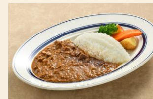
牛タンキーマカレー